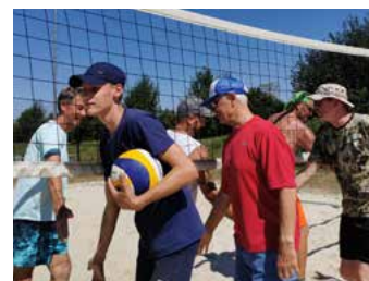
einer Wiederholung im nächsten Jahr riefen.

vom Viktoriaübchen, die sie bestimmt bald einlösen werden. Als das offizielle Turnier beendet war, blieben viele Aktive und auch Zuschauer noch dort und es wurde weitergespielt, bis die Füße qualmten. Am Ende des Tages wurden einige Stimmen laut, die nach