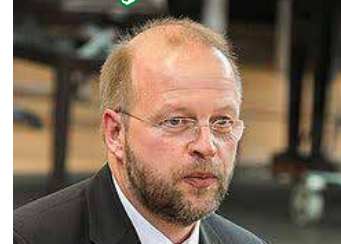
Präsident der Geselligen Vereine Winneken e.V.

Der Schritt zur Gründung eines Sportvereins im Jahr 1922 bedeutete für unser Dorf Winneken eine ganz entscheidende Weichenstellung. Unzählige sportliche Erfolge, Projekte, Feste und Impulse sind in den vergangenen 100 Jahren von diesem Verein ausgegangen, die Viktoria prägt das gesellschaftliche Leben unseres Dorfes maßgeblich mit.